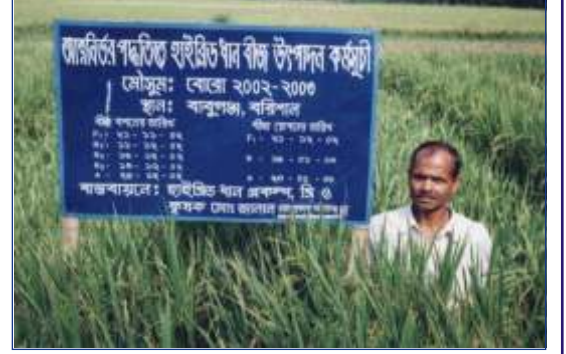
চিত্র: হাইব্রিড ধানের বীজ উৎপাদনকারী একজন কৃষক

হাইব্রিড ধান বীজের অধিক মূল্য ও সীমিত সরবরাহের কারণে আমাদের দেশের কৃষকরা হাইব্রিড চাষে অগ্রহ হারাতে পারেন। তাই যাতে কৃষকরা নিজেরাই হাইব্রিড বীজ উৎপাদন করে নিজের চাহিদা পূরণ করেও অন্য কৃষকদের কাছে বিক্রয় করতে পারে সেজন্য আত্মনির্ভর পদ্ধতি উদ্ভাবন করা হয়েছে। এতে একদিকে যেমন বীজের চাহিদা পূরণ হবে অন্য দিকে কৃষকরা আর্থিকভাবে লাভবান হবে।