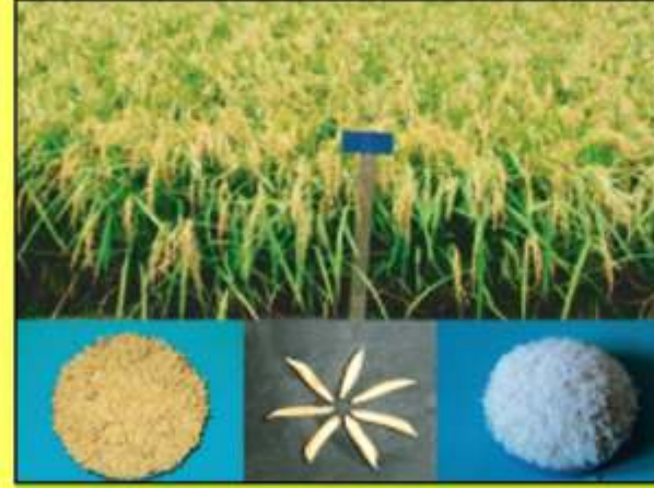
ব্রি ধান৫০: বোরো মৌসুমে সুগন্ধী উষ্ণীয় ধানের জাত জনপ্রিয় বাংলামতি নামে পরিচিত এ ধানের চাল লম্বা, চিকন ও সুগন্ধযুক্ত। গুণ, মান ও ফলনে ভারত-পাকিস্তানের বাসমতি চালের চেয়েও উৎকৃষ্ট। প্রতি হেক্টরে ফলন দেয় ৬ টন।