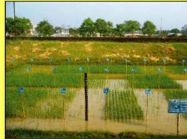
ব্রি ধান৫২: বন্যা সহিষ্ণু ধানের জাত আকস্মিক বন্যার পানিতে ১৪ দিন ডুবে থাকলে অন্য ধান যেখানে বাঁচে না সেখানেও বেঁচে থাকে এ ধান এবং প্রতি হেক্টরে ফলন দেয় ৪.৫ টন। আর বন্যা কবলিত না হলে প্রতি হেক্টরে ফলন দেয় ৫ টন।

গত ৪০ বছরে বাংলাদেশ ধান গবেষণা ইনস্টিটিউট (ব্রি) এর মূল অর্জনসমূহের মধ্যে রয়েছে: