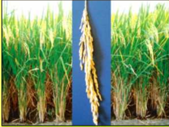
ব্রি ধান৪৯: রোপা আমনের উষ্ণীয় ধানের জাত এটি নাইজারশাইলের মতো সফু চাল বিশিষ্ট ধানের জাত প্রতি হেক্টরে ফলন দেয় ৫.৫ টন।